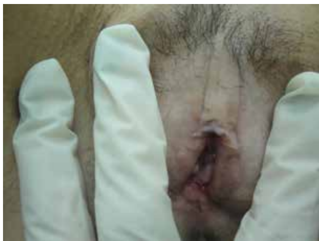
Figura 2. Vulva antes do tratamento com radiofrequência fracionada microablativa

um protocolo experimental de RFM para melhorar o trofismo local e os sintomas clínicos. Ela consentiu e sua inclusão foi aprovada pelo conselho de revisão institucional (CAAE 58353416.2.0000.5449).