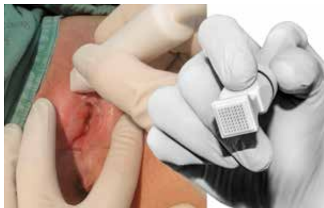
Figura 3. Eletrodo FRAXX fracionado

Cada sessão durou aproximadamente 15-20 minutos. O edema cutâneo leve e a vermelhidão que se seguiram desapareceram 1-3 horas após o procedimento. Os sinais de microablação (Figura 4) desapareceram da mucosa e da pele nos próximos três e cinco a sete dias, respectivamente. A paciente recebeu instruções para aplicar compressas locais de soro fisiológico frio e/ou creme de dexpanthenol 5% duas a três vezes por dia, por dois a cinco dias, e evitar relações sexuais por 10 dias após cada sessão.