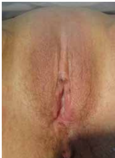
Figura 5. Vulva com trofismo de pele melhorado em 2019

com tratamento contínuo com corticosteroides locais e 3 após RFM anual (em razão de episódios de coceira leves e ocasionais que se resolveram espontaneamente sem a necessidade de corticosteroides locais). Usamos um questionário Likert de 5 pontos (curada, muito melhor, um pouco melhor, sem alterações, pior) para avaliar o estado atual da paciente em comparação com seu estado de pré-tratamento; a pontuação foi “muito melhor”. Finalmente, em uma escala Likert de 5 pontos para avaliar sua satisfação com o tratamento de RFM (muito satisfeita, satisfeita, insegura, insatisfeita, muito insatisfeita), a paciente declarou que estava “muito satisfeita”.